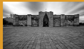
Caravanserraglio di Sultanhanı o Agziharahan