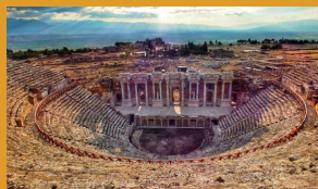
Il teatro dell'antica città di Hierapolis