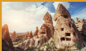
I camini delle fate (Cappadocia)