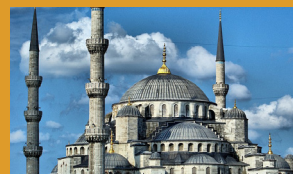
Moschea Blu (Istanbul)