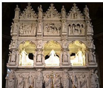
Arca di sant'Agostino